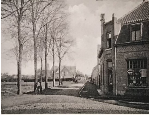
De kruidenierswinkel op de hoek Lijnsheike en Heikant in 1915. Op de achtergrond de kerk

B ankroof is voor Tilburgse begrippen geen dagelijkse kost, maar toen ik in 1965 goed 22 was, vond hier de eerste grote bankoverval in de Nederlandse geschiedenis plaats. Gepleegd door een Franse bende bij AMRO-bank aan de Heuvel. Ik ben er nog gaan kijken, dichtbij waar we daar tegenover vaak gratis het Nieuwsblad van het Zuiden in een vitrine gingen lezen. De buit was 900.000 gulden, wat nu op zo'n 2 miljoen euro wordt geschat.